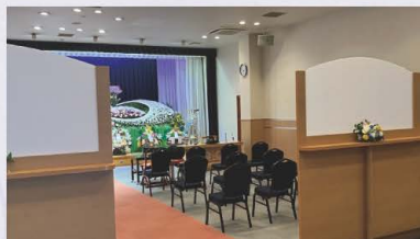
広さ自由に空間アレンジ