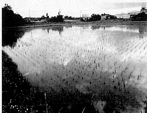
(図1) 散布ほ場の写真例