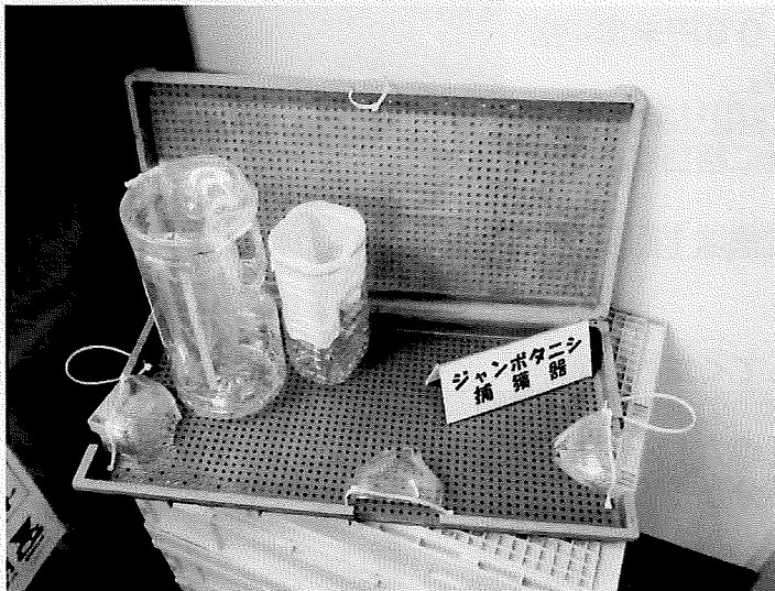
(図1) ジャンボタニシ捕獲器

市ホームページ(QRコード(図2))にて、「ペットボトル」と「苗箱」で作成した捕獲器の紹介をしていますので、ぜひお役立てください。