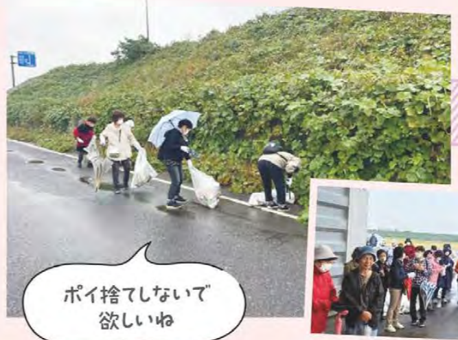
ポイ捨てしないで 欲しいね

一志東部地区女性部は11月14日、環境保全の取り組みとしてゴミゼロハイキングを行い、69人が参加しました。中勢バイパス沿いの下の道路でハイキングを兼ねてゴミ拾い。あいにくの小雨でしたが、みんなで力を合わせ、少しずつ拾いながら歩いた結果、ゴールする頃にはたくさんゴミが集まりました。