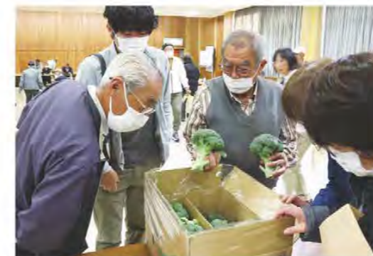
目ざろえ会で規格を統一しました

三重中央地区と一志東部地区では11月からブロッコリーの出荷が始まりました。今年度は定植時期の暑さの影響等により生長が遅れ、例年より2週間ほど遅い出荷開始となりました。また、温暖な気候が続いたことから虫による被害等もありましたが、生産者の努力により品質の良いものが出荷されました。管内では98軒の生産者が約10haの面積でブロッコリーを栽培。3月末まで出荷する予定です。