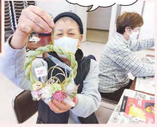
可愛く できました♪