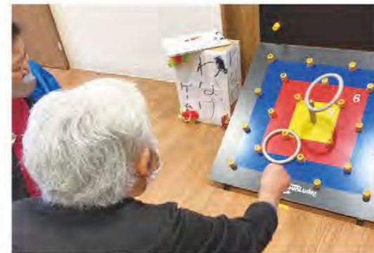
輪投げや釣りゲームを楽しんでもらいました