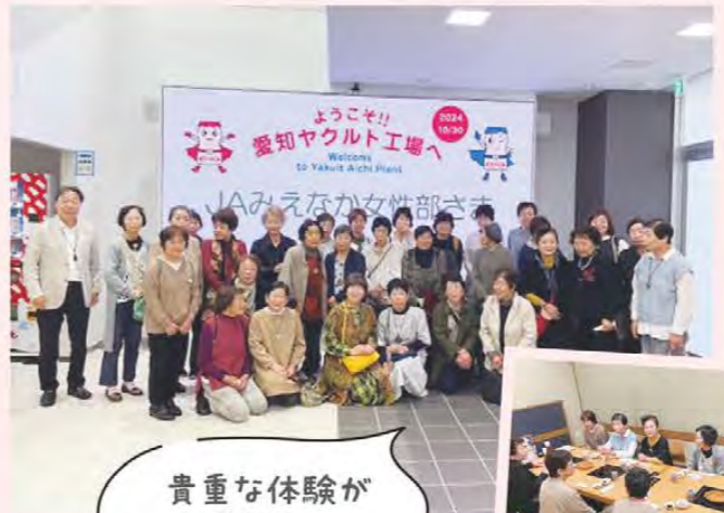
貴重な体験が できました