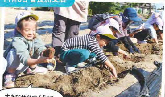
大きなサツマイモが収穫できた! サツマイモ収穫体験