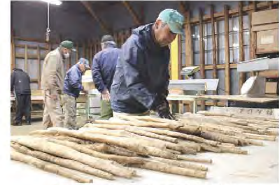
1つひとつ丁寧に出荷作業を行いました

一志じねんじよ部会は11月下旬から12月末までジネンジヨの出荷を行いました。集荷場では朝早くから部会員らが出荷した自慢のジネンジヨを長さや重さで分け、鮮度を保つためのヒノキの葉を添えて化粧箱に詰めました。同部会のジネンジヨは土中に埋めたパイプを伝って生育するため、自然のジネンジヨとは違い、すらっとしたまっすぐな長い見た目が特徴。歳暮品として人気が高く、全国発送を行っています。今年度産は夏の暑さや水不足が心配されましたが、粘りのよい品質良好なジネンジヨに仕上がりました。