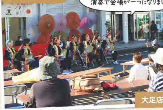
スコープ三味線の演奏で会場が一瞬になりました! 大足店祭