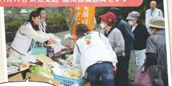
地元産の野菜を販売しました! いいなんふれあい祭り