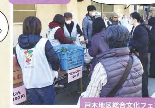
冬野菜の販売を行いました! 戸木地区総合文化フェア