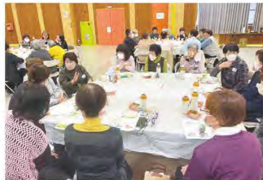
よい交流の場になりました