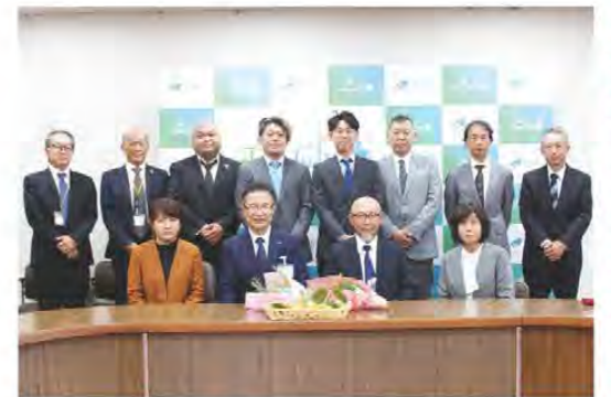
有意義な意見交換会となりました