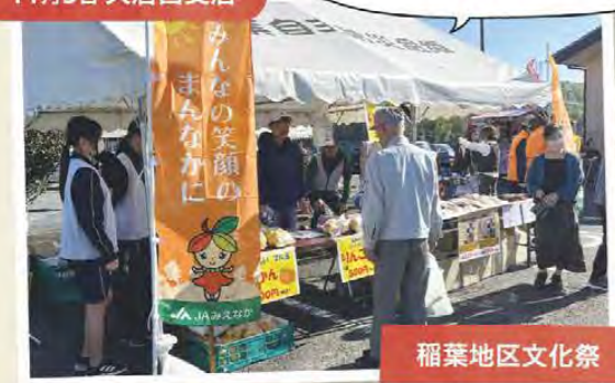
みかんやりんご、あぐりネット商品の販売を行いました! 稲葉地区文化祭