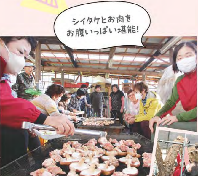
シイタケとお肉を お腹いっぱい堪能!