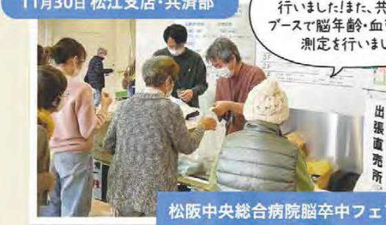
農産物の販売を行いました!また、共済部のブースで脳年齢・血管年齢の測定を行いました。 出張直売所 松阪中央総合病院脳卒中フェア