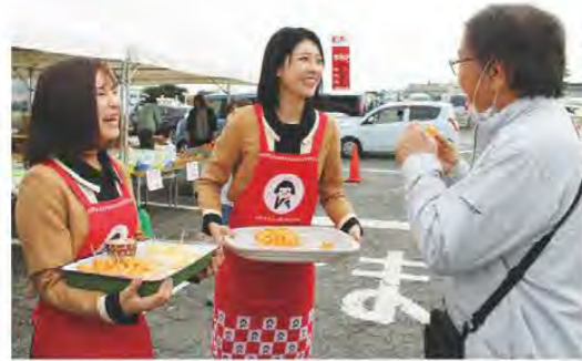
みえなかあぐり隊が地元農産物の魅力をPRしました