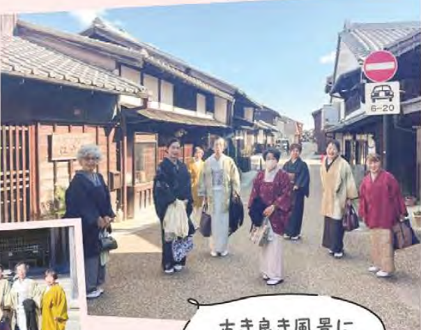
古き良き風景に マッチ♪

きりきらの会「結いの会」は交流会を開き8人が参加しました。今回は着付けだけでなく、着物を着て閑宿を散策。昔ながらの町並みや、お寺などを着物で歩き、普段よりちょっとウキウキした気分が散策を楽しみました。秋晴れの暖かな気候で、思い出に残る良い一日になりました。