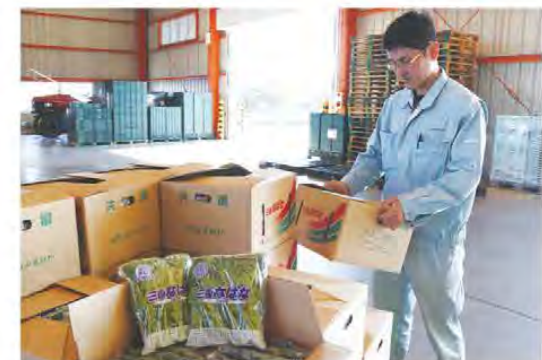
綺麗なナバナが出荷されました

JAみえなかでは11月からナバナの出荷が始まりました。今年度産は10月以降も暖かく、風が強い日が多かったことから病虫害の発生が見受けられたものの、生産者による防除の徹底により、品質の良いナバナが出揃いました。ナバナは「みえの伝統野菜」に選ばれており、当JA管内は県内でも有数の産地。独特のほろ苦さがありながらも、和洋どんな料理にもあう冬野菜です。管内では115人が約8.2haでナバナを栽培。晩生品種の栽培も行っており、3月いっぱいまでの出荷を目指します。