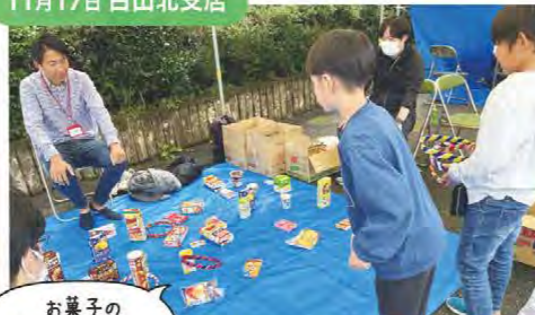
お菓子の輪投げコーナーが大人気でした! 大三・倭地区文化祭への出店