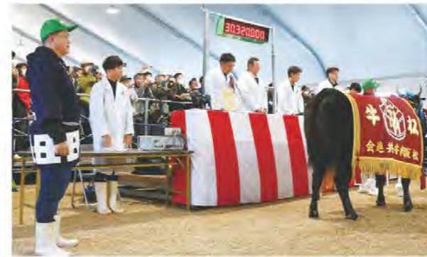
3,032万円で競り落とされた優秀賞1席「ともみ7」号