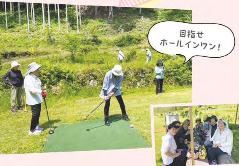
目指せ ホールインワン!

美杉女性支部は6月12日、津市美杉町にある美杉パークゴルフクラブでパークゴルフを行い、47人が参加しました。暑い日となりましたが、大自然の中でパークゴルフを楽しみながら会員同士交流を深めました。