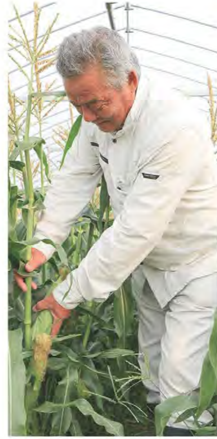
甘さと大きさのある トウモロコシに 仕上がっていました