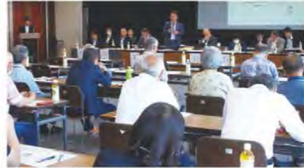
いざわ・くしだ・くろべ地区 (6月5日)