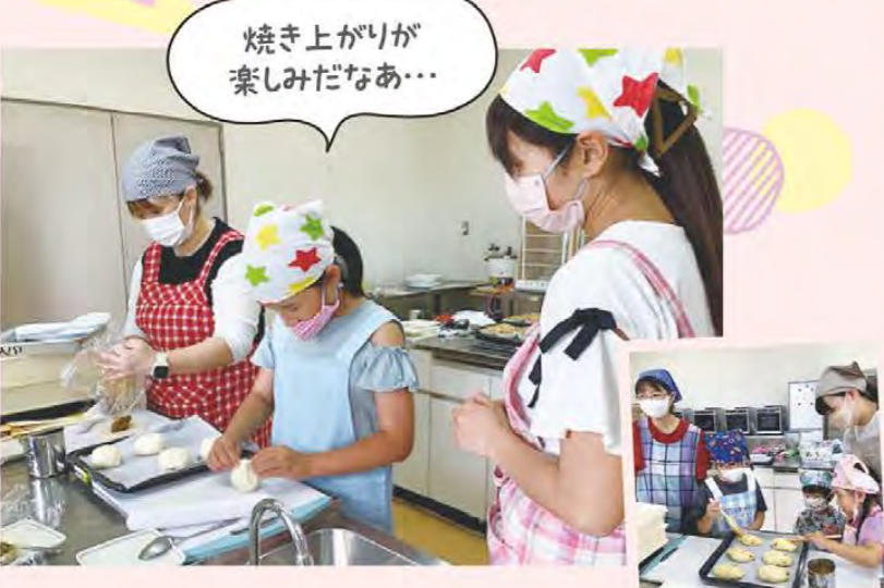
焼き上がりが 楽しみだなあ...

フレッシュコムズは6月15日、ウエストパーク松阪でパン作り教室を開き、17名が参加しました。シュガーブレッドの3種類を作りました。参加した子どもたちは焼き上がったパンを見て「おいしそう!早く食べたい!」と喜んでいました。