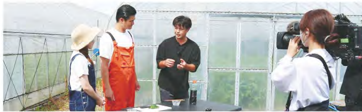
モロヘイヤの魅力について発信しました