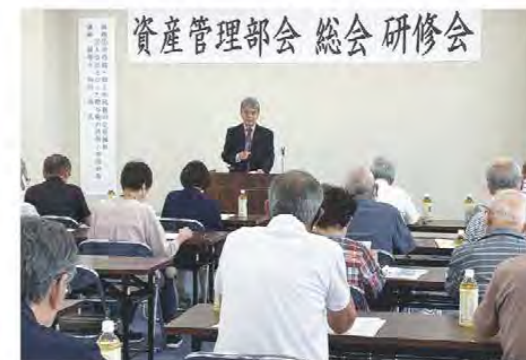
前川税理士の講演を聞く参加者ら