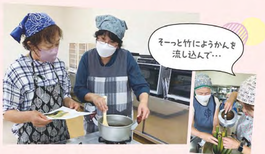
そーっと竹にようかんを 流し込んで...

大足女性部は6月12日、ウエストパーク松阪でクッキング教室を開き、16人が参加しました。今回は竹ようかんづくりに挑戦。竹は女性部員が採集したものを使用しました。オリジナルの竹ようかんが完成しました。