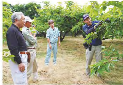
松阪地区柿生産部会 摘果を学ぶ