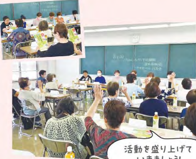
活動を盛り上げて いきましょう!

一志東部地区女性部は6月6日、香良洲支店で「第1回班長会」と「第2回役員会」を開催し、24人が参加しました。会議では一志東部地区の本部活動計画について意見交換を行いました。また、午後の役員会では、今後行われるゴミゼロハイキング等の活動や、ふれあい旅行についても話し合いました。話し合った内容をもとに、今後の女性組織活動の内容を検討していく予定です。