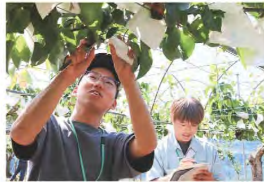
松阪地区梨研究部会 果形調査生育順調