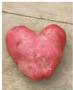
ハート形 松阪市殿村町 匿名希望さん 畑で採れたじゃがいも です。