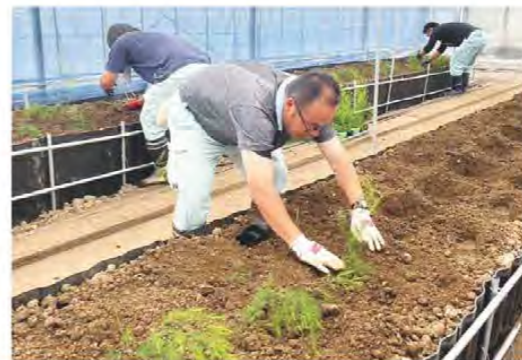
育った苗を丁寧に定植しました