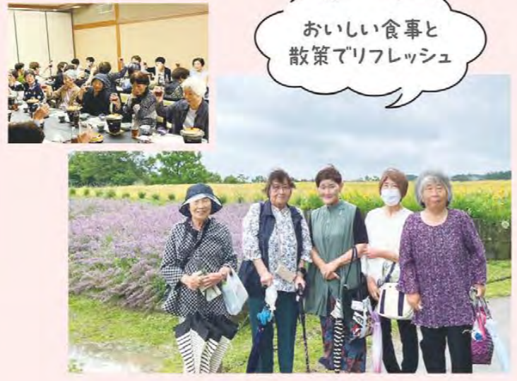
おいしい食事と 散策でリフレッシュ

一志東部地区女性部は6月21日、28日にメナード青山リゾートで日帰り旅行を開催し、83人が参加しました。梅雨の時期のお出かけでしたが天候に恵まれ、ラベンダー畑とハーブガーデンの散策を楽しみました。昼食には和食御膳を食べながら会話を楽しみ交流を深めました。