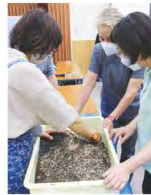
熱心に講義を受けて いました