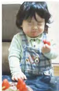
初めての苺 津市榑原町 カンコちゃんさん