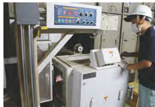
新しくなったボイラー(白山ライスセンター)