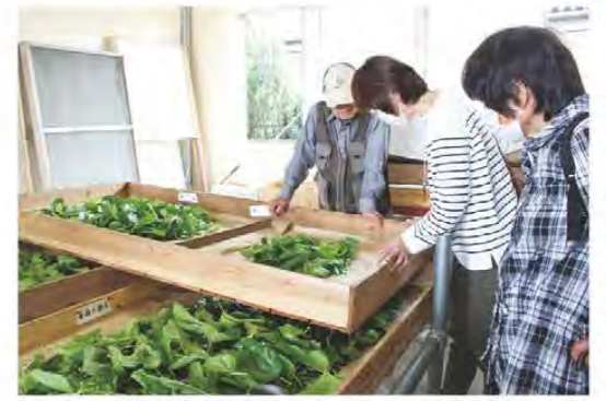
県内外からたくさんの方々に来ていただきました