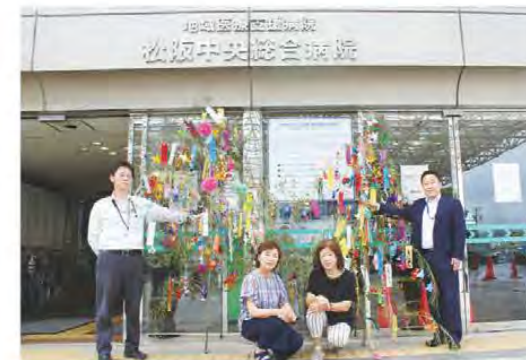
来院者に笑顔を届けました