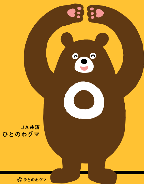
JA共済 ひとのわぐま

お客様の大切な現金等重要物をお預かりする際は、 受取書・領収書 等を必ずお渡ししております。