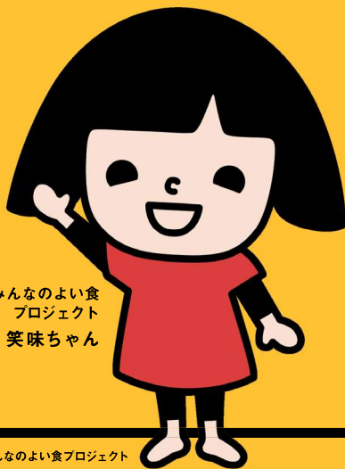
みんなのよい食 プロジェクト 笑味ちゃん